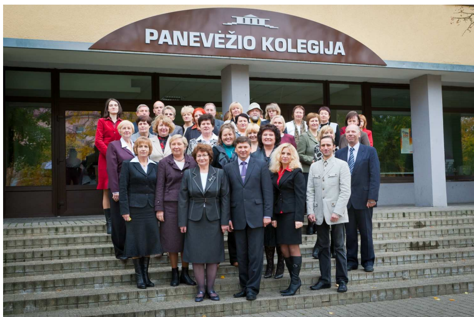
Verslo ir technologijų fakulteto dėstytojai

Iš Europos Sąjungos struktūrinių fondų į aukštąjį mokslą ateinančios investicijos neaplenkia ir Panevėžio kolegijos Verslo ir technologijų fakulteto. Atsiranda vis geresnės galimybės atnaujinti studijų infrastruktūrą, modernizuoti esamas laboratorijas ir įkurti naujas.