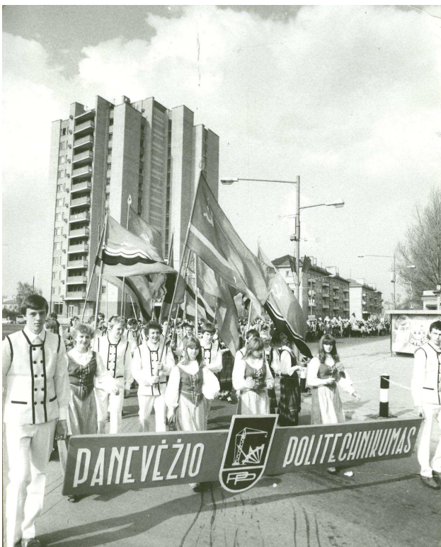
Panevėžio politechnikumo moksleiviai

2002 m. Panevėžio aukštesniųjų mokyklų pasirengimas teikti aukštąjį išsilavinimą ekspertų buvo įvertintas teigiamai, ir Aukštesnioji technikos mokykla tapo Panevėžio kolegijos akademi-