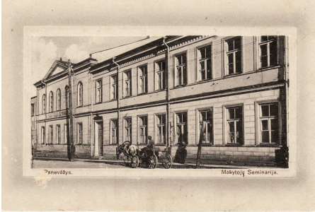
Mokytojų seminarija, XIX a. pab.

1727 m. – netoli dabartinių Panevėžio kolegijos Verslo ir technologijų fakulteto pastatų, Nepriklausomybės a. šiaurinėje dalyje vienuoliai pijorai pastato bažnyčią, vienuolyną ir mokyklą – kolegiją. Tuo metu ji atliko aukštesnės (arba vidurinės) mokyklos funkcijas.